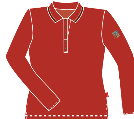
Polo Manches Longues Item: 780