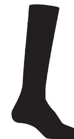
Bas 3/4 item : 966