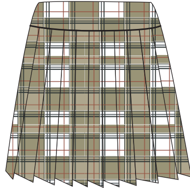
Jupe Tartan Avec Yoke Item: 199