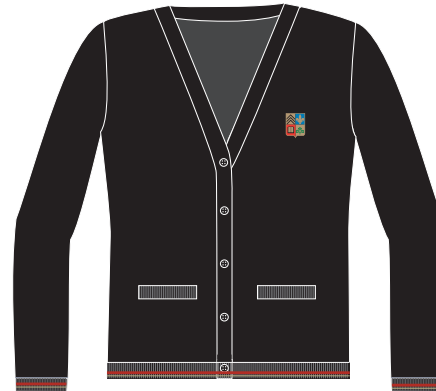
Cardigan Noir-Lisé Item: 529