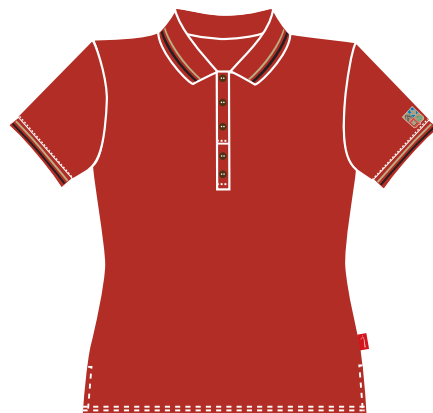
Polo Manches Courtes Rouge Item: 341