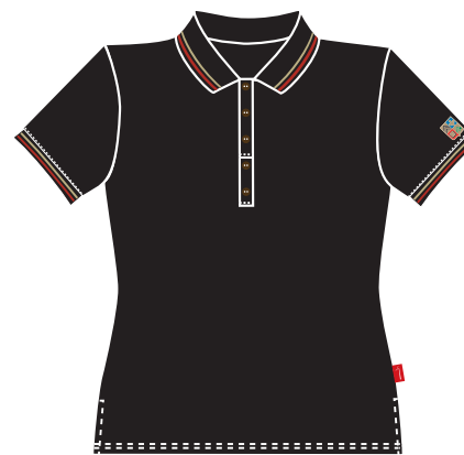
Polo Manches Courtes Noir Item: 342