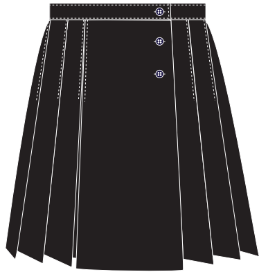
Kilt Noir Item: 141