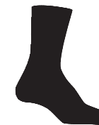
Bas Courts item : 974