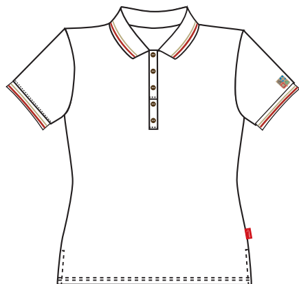
Polo Manches Courtes Blanc Item: 340